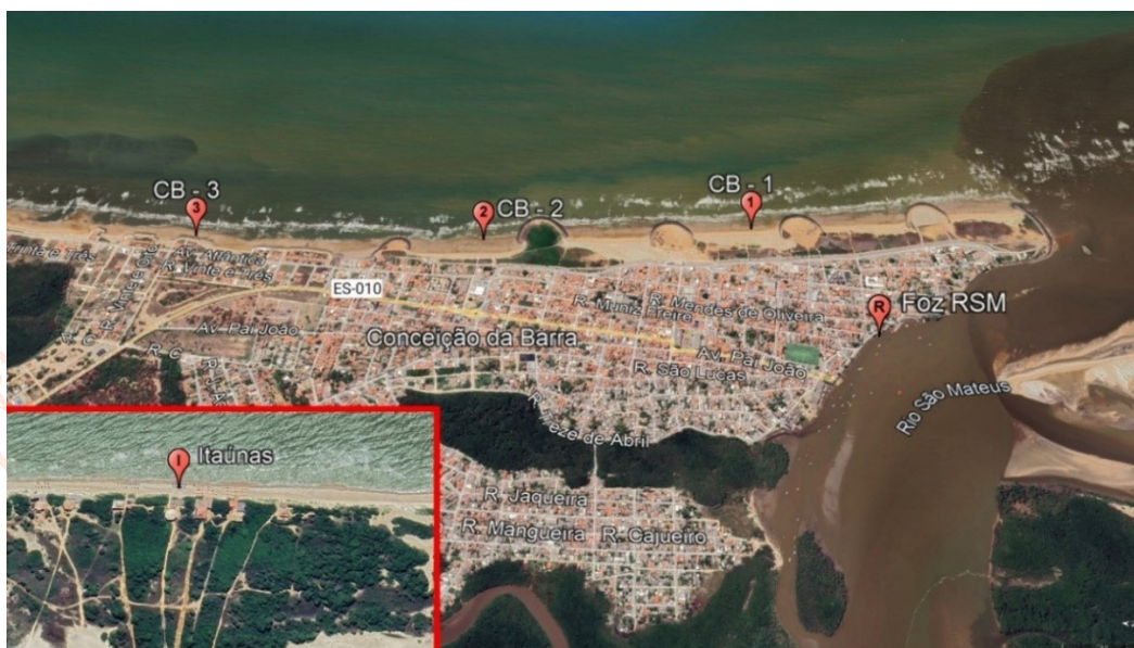
FIGURA 1 - Pontos amostrados nas praias de Conceição da Barra (CB 1, 2 e 3), no Rio SM e em Itaúnas.

As amostras de água marinha foram coletadas nas praias de Conceição da Barra (CB). Iniciou-se pelo ponto (CB-1), próximo à foz do Rio São Mateus (coordenadas: 18°35'27.92"S e 39°43'42.59"O), depois no ponto (CB-2), na porção central (18°34'58.18"S e 39°43'47.91"O), e no ponto (CB-3) mais ao norte da região da sede municipal (18°34'26.07"S e 39°43'51.19"O). Uma na foz do Rio São Mateus-RSM (18°35'41.14"S e 39°43'57.25"O), pois este é a provável fonte da contaminação bacteriana constatada nas praias. E uma amostra na praia de Itaúnas, próximo às barracas (18°24'52.39"S e 39°41'51.99"O).