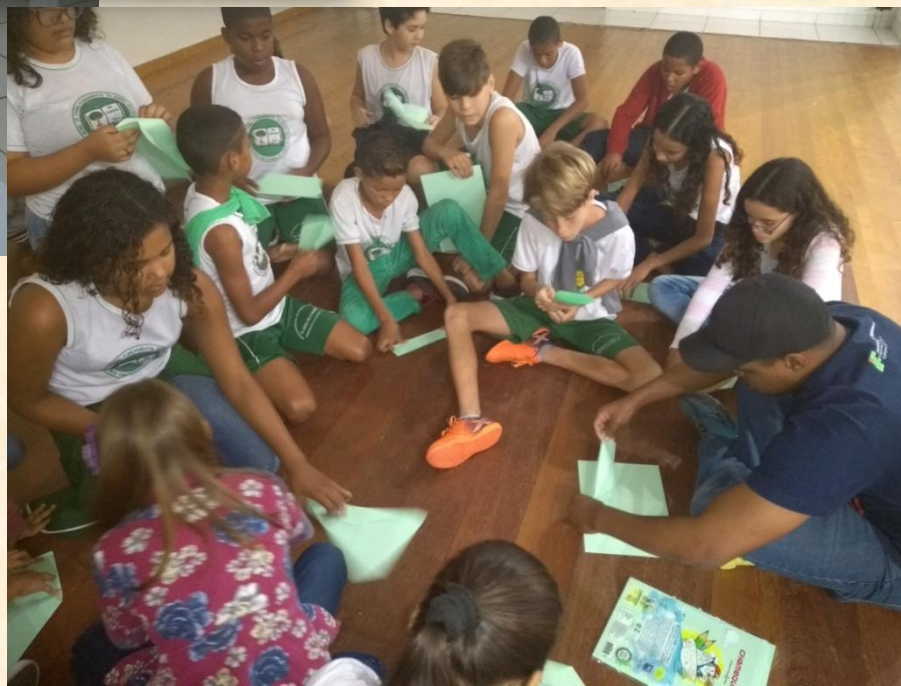
Oficina Aerodesing (IFES)