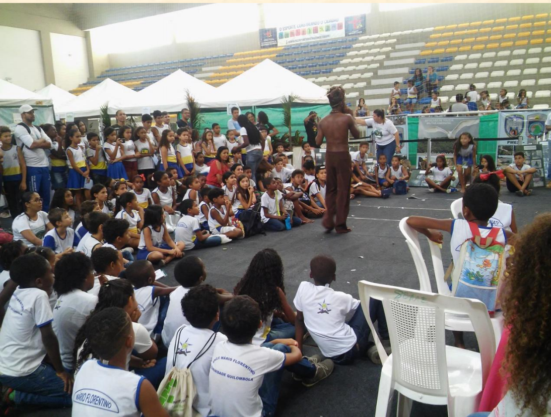
Teatro UFES: "O Curupira"