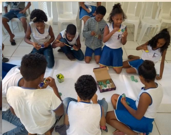
Oficina de Reciclagem com a Cáritas